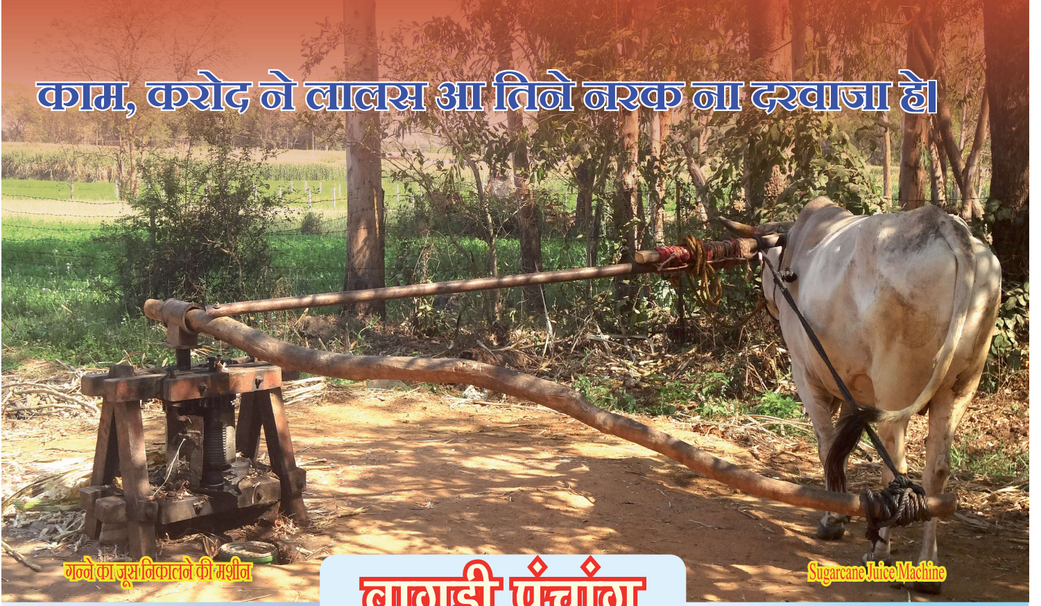
गन्ने का जूस निकालने की मशीन